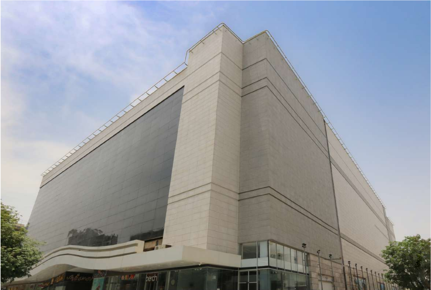
CITY CENTER Commercial Complex